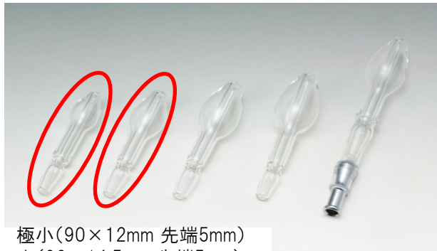
極小(90×12mm 先端5mm) 小(93×14.5mm 先端5mm)

鼻水吸引を目的として開発されたガラス製吸引オリーブ管が納品されました。 透明なため吸引する時に鼻水の状態が把握できます！