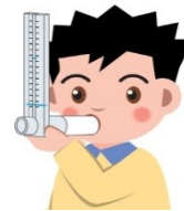
ピークフローメーター (パーソナルベスト)