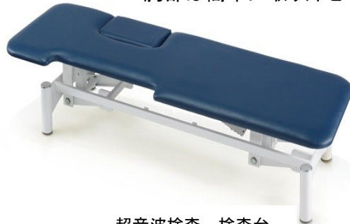
超音波検査 検査台